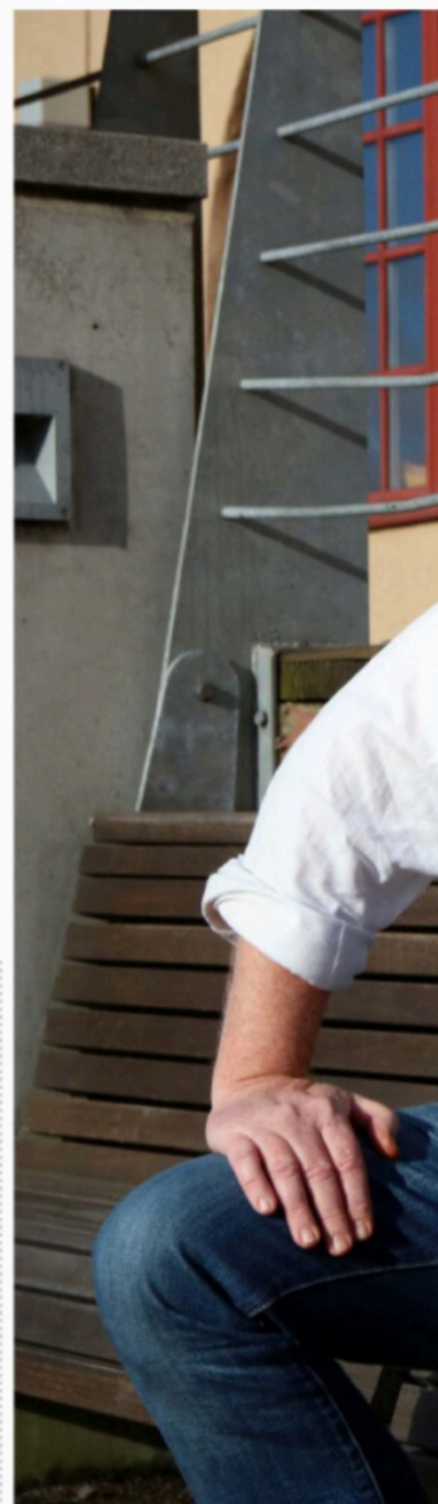
*Skulle Higab komma fram till att de vill sälja Lagerhuset så skulle